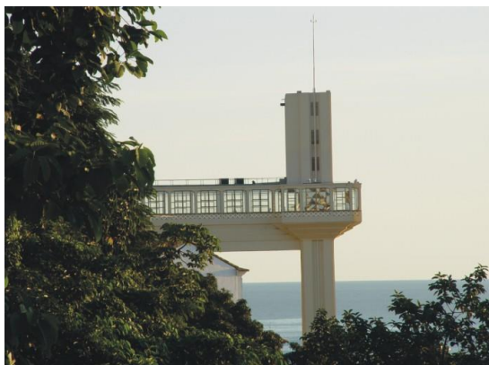
Elevador Lacerda (vista inusitada)